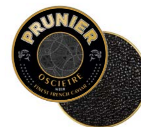
PRUNIER OSCIÈTRE NOIR

Grand classique de la maison Prunier, ce caviar brun et délicat séduit les palais grâce à ses notes de noisette, enveloppantes et généreuses en bouche.