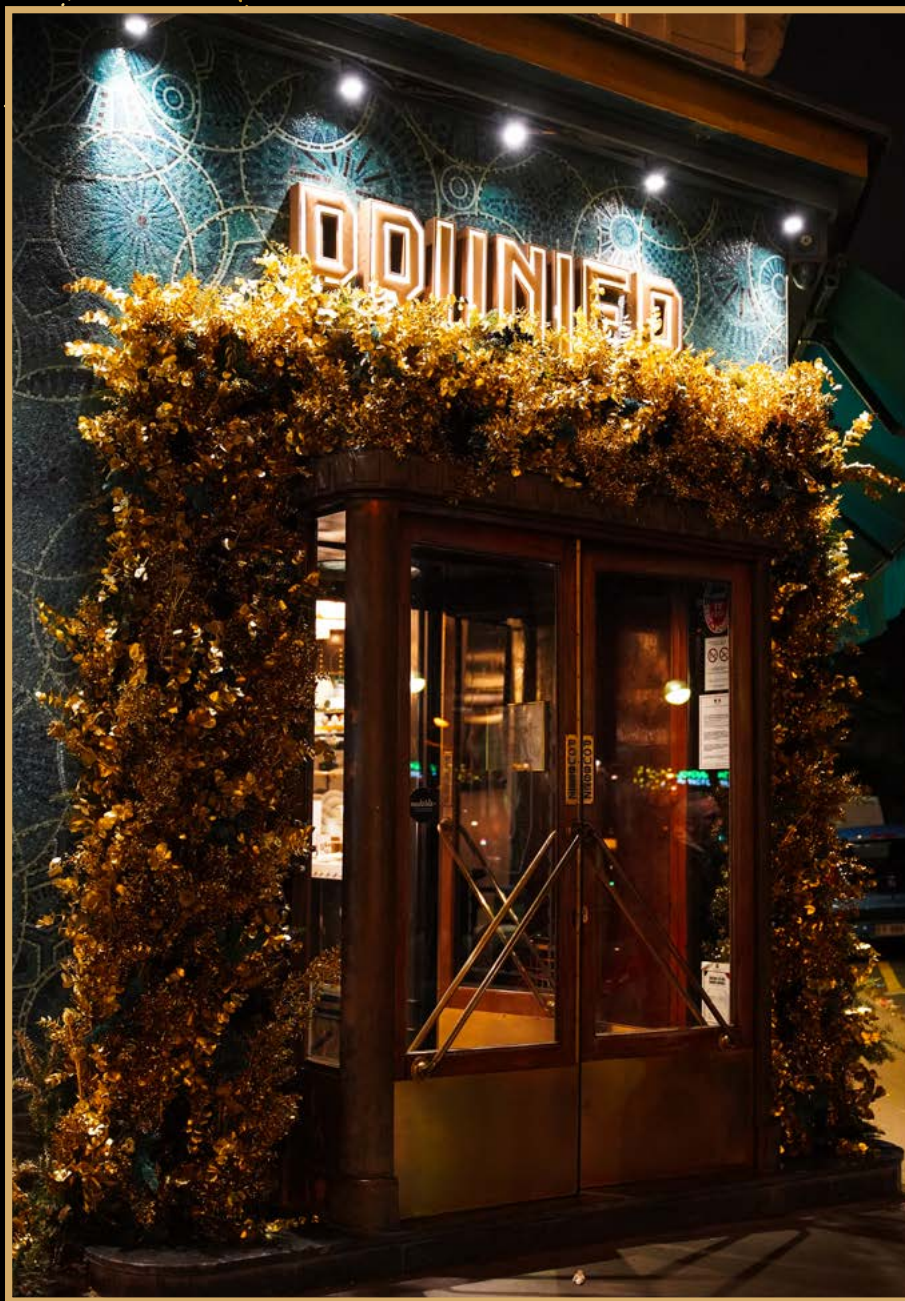
LE FABULEUX NOËL DE PRUNIER