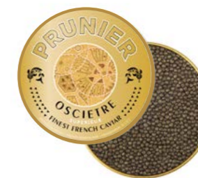
PRUNIER OSCIÈTRE SUPÉRIEUR

Un caviar rare, dont les grains généreux laissent un goût iodé durable en bouche. Paré d'une robe noire profonde, il ne représente que 10% de la production Prunier.