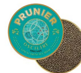
PRUNIER OSCIÈTRE HERITAGE

Prisé pour ses notes crémeuses, qui caressent avec persistance les papilles, ce caviar gourmand a la spécificité d'avoir des grains couleur brun-gris clair de lune.